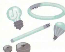
電池や蛍光灯、水銀体温計 (水銀を含むもの)

電池類をつけたまま出されて、運搬車両や処理施設において衝撃が加わった際に発火する火災事故などが全国で多発しております。また、ボタン電池などには少量ですが水銀が含まれており、焼却するときに気化し、通常使用しなくてよい活性炭などを大量に消費することになります。そのため絶対に混入させないで下さい。