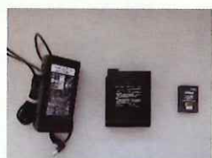
バッテリー・電子たばこ (リチウムイオン電池を使用しているもの)