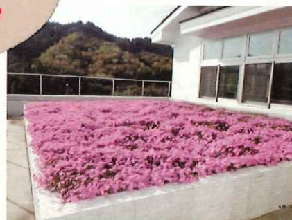
↑ 研修室隣の庭園に咲いた芝桜