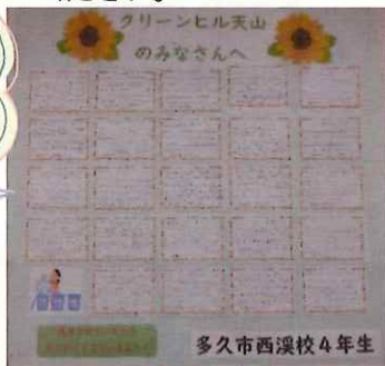
多久市西溪校4年生